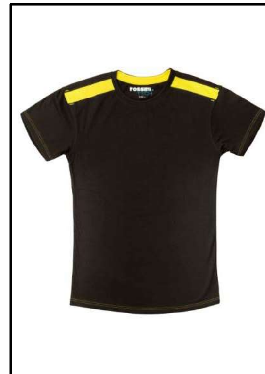
91 – WARM GREY