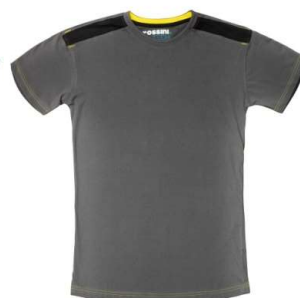
12 – GRIGIO