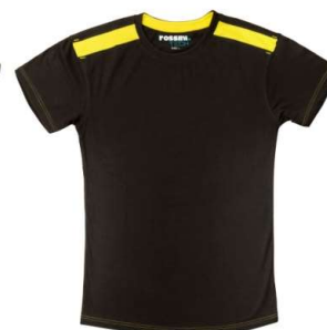
91 – WARM GREY