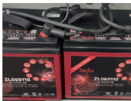
Vano batterie AGM