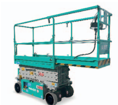
Estensione manuale piattaforma 1 m