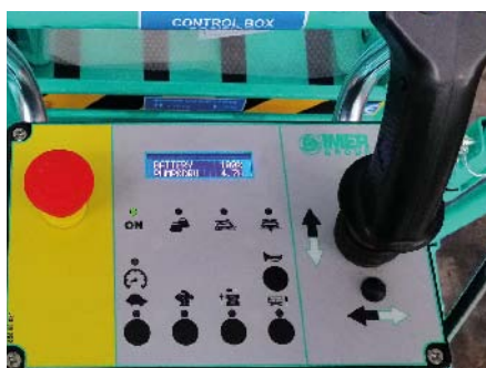
Quadro comandi sulla piattaforma semplice e intuitivo