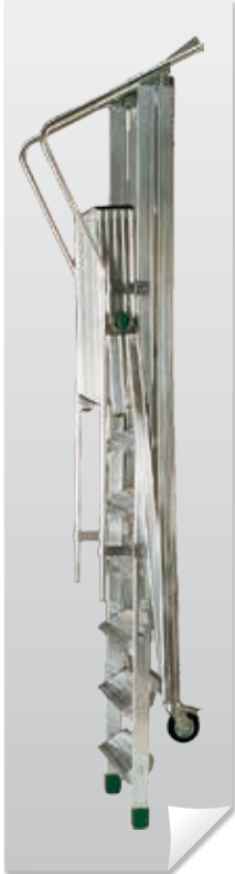
Trasporto e stoccaggio