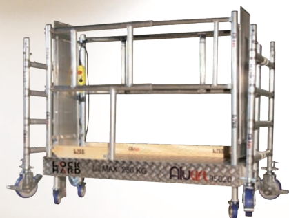
Article no. 100 S